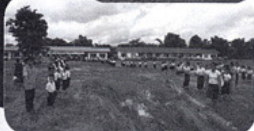
新築の学校とトイレ