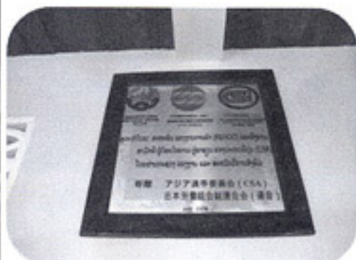
ラオス労働省・連合・CSAの銘板