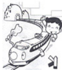
タイとラオスに開通した鉄道