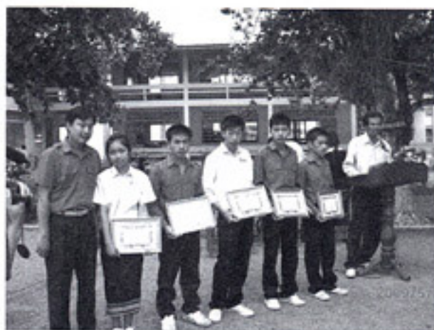
高卒認定試験で優秀な成績の表彰を受けた寮生