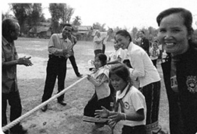
村人も子どもも綱引きに夢中

村人との交流も持たれ、子供たちと団員との綱引き、食事、ラオスのダンスなどが催されました。この引渡し式を中心にCSAの小学校建設について、ラ