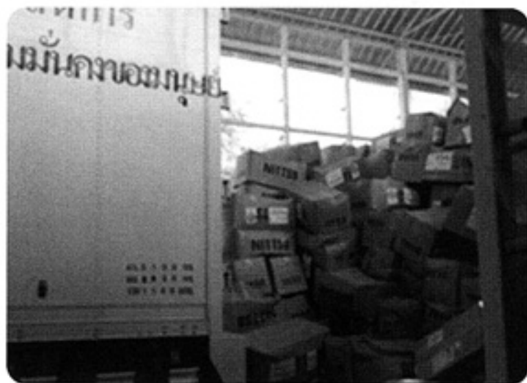
タイ福祉省倉庫に届いた衣類カートン

タイ社会福祉開発省制作のCSAワーキングスタディツアー紹介のYouTube映像は以下で見ることができます。