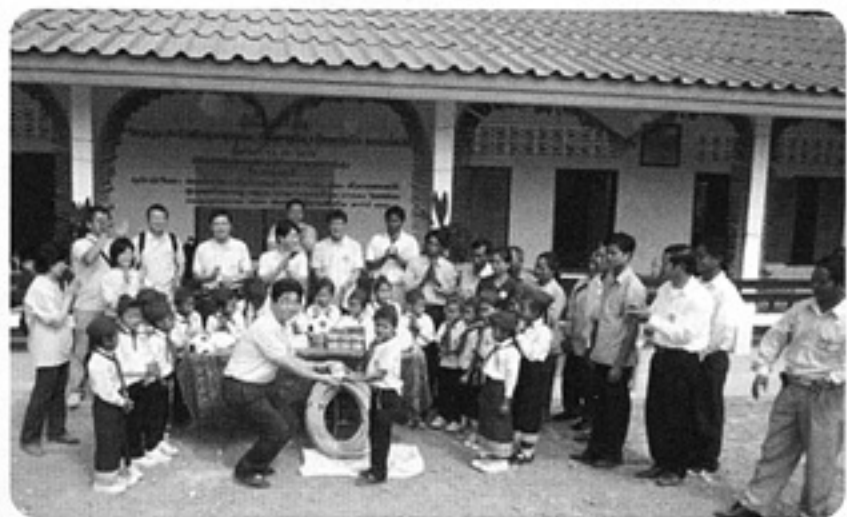
学校引渡し式で文具などを贈呈

パーウドム村はラオス北部のボケオ県の県庁所在地であるフェーサイから車で約3時間半、2000年に建設した10番目校のサイウドム村小学校から約30分に位置します。式典では郡長からCSA、連合への感謝が述べられ、民族衣装をまとった村の少女たちからメンバー全員に花束が手渡されました。