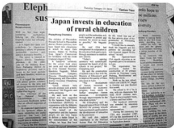
ラオスの日刊英字新聞「Vientiane Times」がCSA活動を紹介