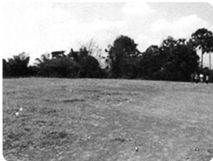
ムアンワァー村の建設予定地

また、22番目校・2011年建設予定地は、パクライ地区ムアンワァー村より西方より約8キロのところに位置している、サイニャブリー県パクライ地区ナマイ村とすることも確認されました。