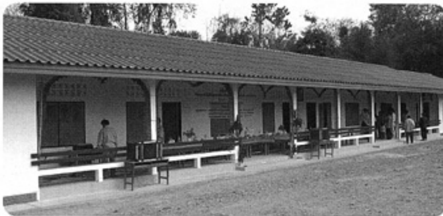
新築の20番目校、パーウドム村小学校