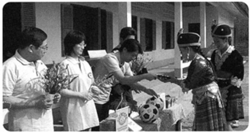
感謝の野の花の花束贈呈