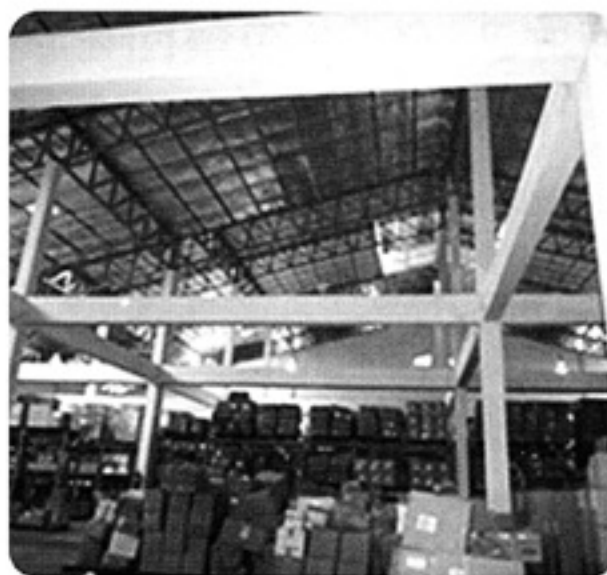
救援衣類の保管場所：ラオス保健省倉庫