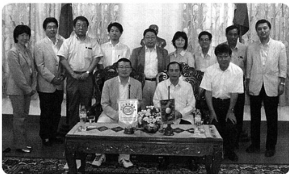
ラオス保健省・副大臣と共に