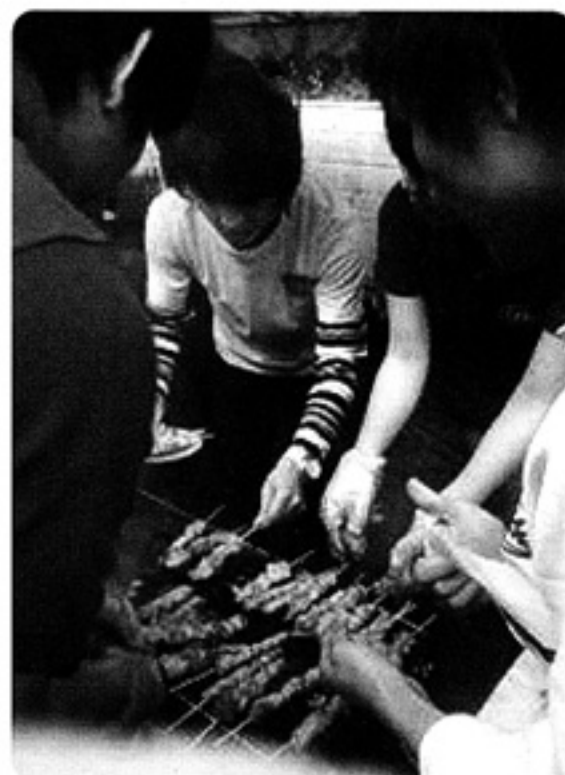
焼き鳥を懸命に作る留学生