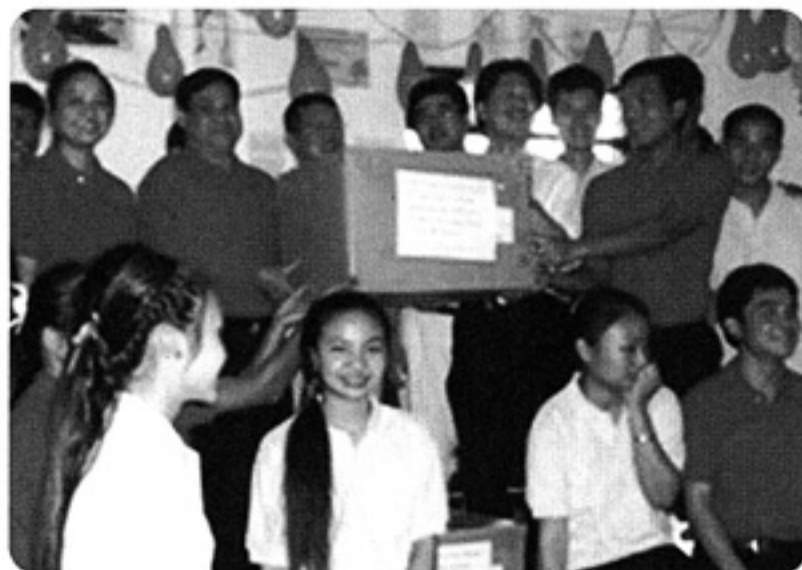
救援衣類をラオスの高校生寮に贈呈

「遠隔地高校生支援事業」を行っているルアンパバン市内のサンティパーブ高校寮にはラオス北部から貧困などのために通学できない高校生支援のために収容人数90名の寮を運営しています。毎年30名の優秀な生徒が入寮し、勉学に励み、進学しています。ラオス国内の大学のほか、ベトナム、中国などにも国費留学し、日本には既に4名留学しています。今回は寮生や先生と食事をつつ意見交換を行い、さらに歌や踊りで交流を深めました。