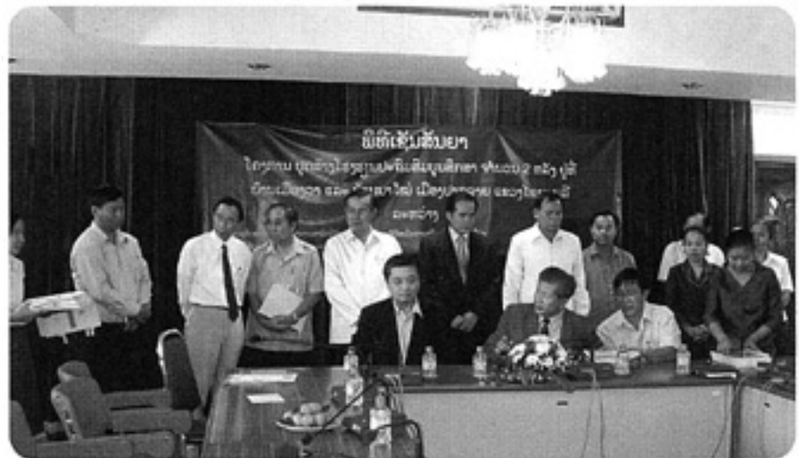
小学校建設の契約調印 — ラオス教育省にて