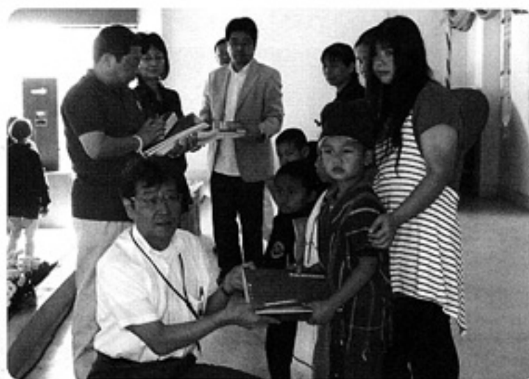
タイ山岳部族の子供たちに文具を手渡す

バンコクでは配布前に救援衣類が保管される福祉省の倉庫を訪問し、到着している荷物の中身をチェックし、衣類の仕分けに携わっている職員と意見交換を行い、「CSAからの衣類は清潔で助かる」、「恵まれない地域の人々が喜ぶのでやりがいがある」、といった意見を直接聴くことができました。