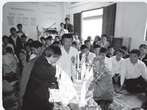
サンティパーブ高校寮では生徒も参加

ラオ・ラーオというラオスの地酒(50℃近い)をまず主役(来賓代表)が全部飲み干さなければなりません。その後、順次ラオ・ラーオが注がれ、来賓全員が飲んだあと、参加した村人たちも飲み始めます。何回も勧められ、そのたびに飲み干すのは大変です。