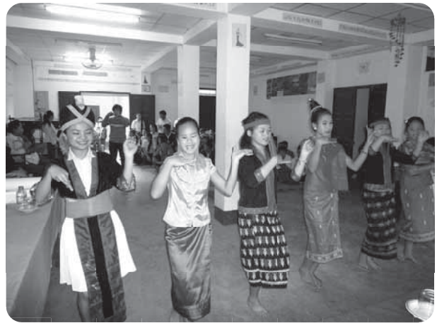
女子学生による民族舞踊

最後は寮生の部屋を各階を見学させて貰った。部屋は6人部屋で共同生活をしており、炊事、掃除、買い物も当番制とするなど、完全自立をしていた。部屋はあまり広くなく、狭い中での個人スペースで勉強をしており、狭い中でも一生懸命に勉強している様子が伺い取れた。