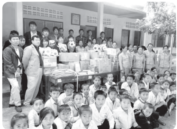
文房具や衣類を贈呈

卒業率は96%であり、そのうち99%が中学校に進学する。中学校は3キロ離れている。ナムバク郡は83村、10グループで構成されており、ホアナ村のグループには高校、