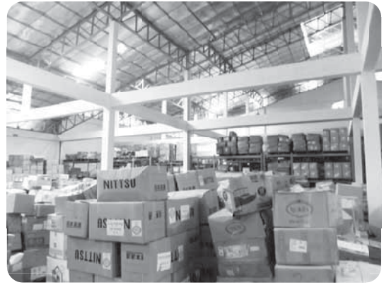
しっかり届いていたことを確認した救援衣類

倉庫視察後、ヴィエンチャン市内有名レストランで、インラバン保健省副大臣の招待で昼食会が持たれた。正式なラオス料理を賞味させていただき、意見交換を行った。救援衣類を送る運動が評価・感謝されていることが伺われ、多くの方々のご支援をありがたく感じた。