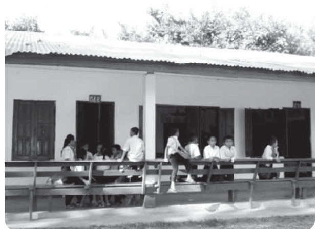
校長より説明と依頼を受けた校舎

なお、現在小学校で教えている先生方の半分はホンガム村小学校の卒業生であり、高校卒業後に専門学校へ進み、村に戻ってくる若者が多いとのこと。小学校の施設や器材の整備についても、先生方と村人の連携のもとで行われているとのこと。