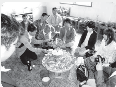
ホアナ村のバーシー儀式

CSAワーキングスタディーツアーが小学校、高校寮などを訪問する際、歓迎の意を込めたバーシー儀式がよく催されます。村人は朝早くから、飼っている鶏などの料理や儀式を準備し、子どもたちが学校で勉強できるようになったことや衣類を贈られたことへの感謝の気持ちを表してくれます。手首に巻いた糸は切ってはならず3日間はつけておく、といわれていますが、村人や生徒たちの気持ちのこもった糸は自然に切れるのを待ちたくなります。