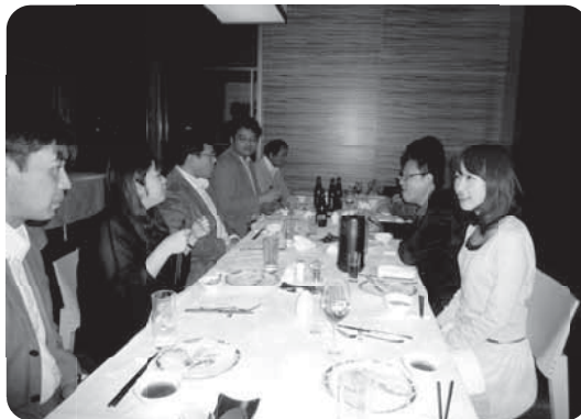
事前研修会・懇親会 —メンバーの初顔合わせ

最初は緊張気味だったメンバーも徐々に打ち解けた懇親会后、羽田国際空港行きシャトルバスで移動、JALの自動チェックイン機で各自、タイ・バンコクまでの搭乗券を発券、荷物は到着地ラオス・ヴィエンチャンまでスルーカーゴで送る手続きをおこなった。日付けが変わり、いよいよ空港に向けてCSAスタディーツアーの出発。