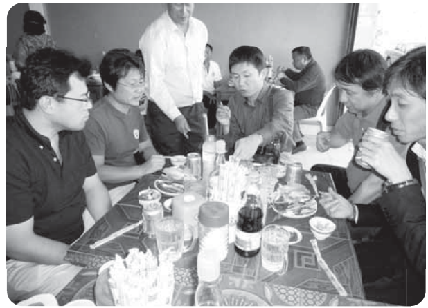
ラオス麺で最初の昼食

その後、ヴィエンチャンのシンボルともいえるタートルアン寺院、凱旋門などを視察。夜はメコン河沿いのレストランから対岸(タイ)を眺めつつ、翌日からの公式訪問の日程を確認し、視察の決意を新たにしました。