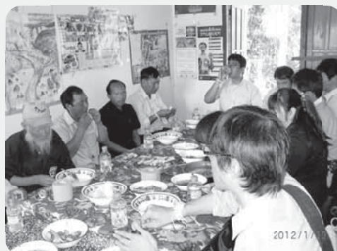
ターディンデンタイ村の大長老と長老

バーシーは、ラオスの人々が結婚式等様々な祝い事、歓送迎などに行う儀式で、村の長老の祈りとともに手首に白ないしオレンジ色の糸を結びつけ、健康や人生の成功などを願う儀式です。部屋の真ん中に飾られたバーシーのお膳には、お米の入った托鉢用の鉢、丸ごとゆでた鶏、ゆで卵、バナナ、お菓子などが盛られ、花やバナナの葉をつなげて竹ひごに刺した長い飾り(時々造花で代用)と、白い木綿糸が1本ずつ房のように結ばれた細い竹ひごが飾られています。多くの場合はその村の長老が祈祷師の役割を務めます。長老が祈祷後、来賓の一人一人に祈りを唱えつつ糸を手首に結び、来賓はバナナ、鶏肉等を手に持ち祝福を受けます。その後、他の村人たちが来賓の手首に健康、成功、旅の安全などを祈りながら糸を巻いてくれます。