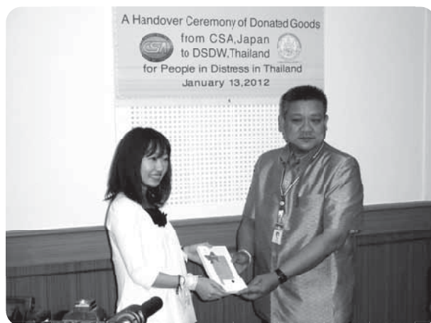
タイ社会開発福祉省における衣類贈呈式

今回の訪問に感謝すると共に、CSAの目的とする復興・支援に対して私たちも一体となって今後も取り組んで行きます。」との挨拶があり、双方の記念品を交換した。