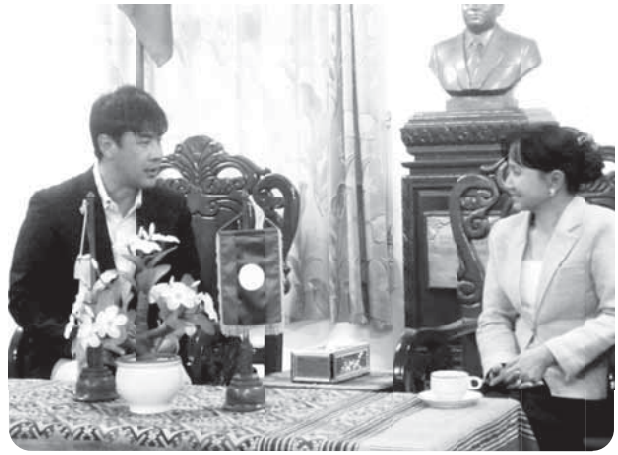
石川団長より団を代表し挨拶

啓発・啓蒙がどれくらい行われているかとかはわからないが、私を感じた感想としては、マラリヤなどに対する民間の人の感覚は薄く、どこにいても蚊は多いし、商店や家の門戸も開いたままだったりと気にしているとは思えない状況だった。通常の飲食店でもハエやコバエが沢山飛んでおり、日本人は意識しすぎかもしれないが、そこまでの意識がまだ