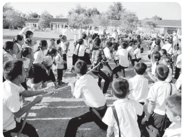
生徒対抗の綱引き