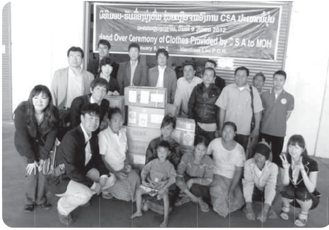
救援衣類贈呈式、村人も参加