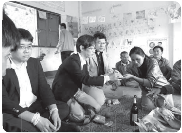
小学校でのラオス伝統の歓迎儀式バーシー

村の人々は、日本の震災を気にかけてくれており、村で義援金を集め、教育省に届けたという話であり、CSAを通じた支援に大変感謝をしていることがうかがわれた。