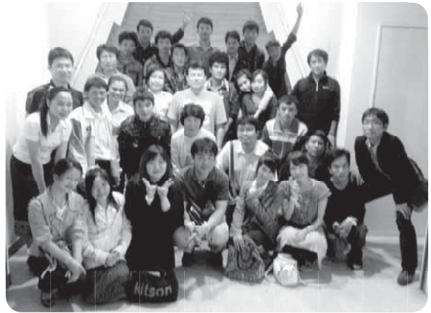
高校寮卒業生(ラオス大学生)と

参加した学生は全員、ルアンプラバンにある高校生支援のためのCSA寮を優秀な成績で卒業後、ラオス国立大学に進学し、経済学部、法学部、文学部、理学部、医学部等に在籍している。彼らは感謝の気持ちを表しつつ、学生生活や将来の夢などを目を輝かしつつ語ってくれた。また、私たちが「ラオスが大好きだ」ということを非常に喜び、愛国心の高さといった面も見せてくれた。スタディ・ツアー参加者からは、「大学で自分の目標に向かい熱心に専門の勉強に励む学生達と話をすることができて嬉しかった」、「学生の純粋さに感動した」、「彼等にはこれからのラオスの発展を担ってほしい」と等の感動に満ちた感想が述べられた。