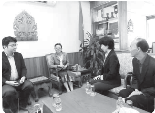
センデュアン教育副大臣と意見交換

政府また日本友好協会副会長として今回の訪問に感謝します。今後もより良い交流が図れることを期待します。CSAの支援はラオスの教育発展の為にとても助かっています。震災時の義援金については、今までラオスの方が日本の政府やNGOから色々な支援をいただいたと思っており、今回の震災はラオスでも非常に悲しく思っていました。私自身も9月に青森へ訪問する機会があり、津波の被害等も確認し大変だと感じました。最近のニュースによると被災地が復興してきている様なので良かったと思っています。今回のスタディーツアーを通じて国・文化・教育の発展を見て行って下さい。