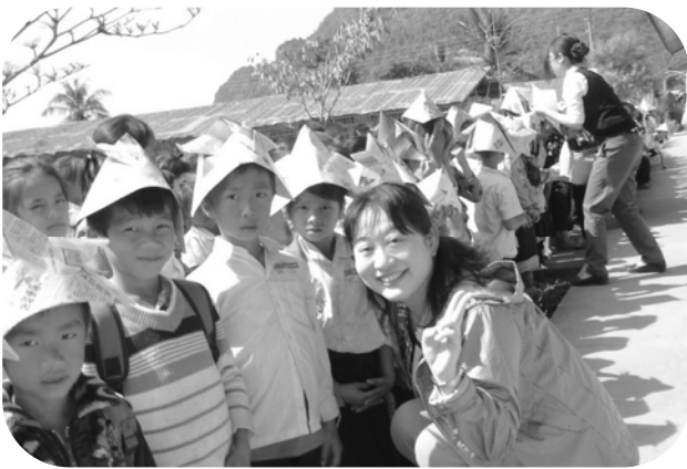
ファサン村の小学生と