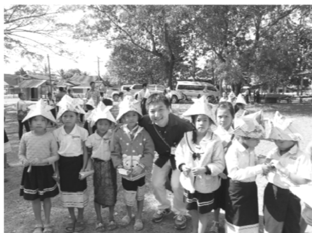
ナカン村小学校で

まず、1点目は現地の小学校を訪問したことです。小学校は3校訪問しましたが、最初に訪問したファサン村小学校(24番目校)では基幹