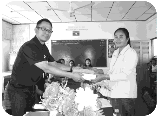
ホアナ村小学校の校長と

到着翌日に早速小学校の訪問となり、まずは基幹労連が設立した24番目校であるファサン村小学校の訪問。2014年に完成した校舎のため非常にきれいな印象であり、さらに鉄骨構造であるとのことで、時代は進んでいるんだなと感心してしまいました。また、昨年井戸のポンプを寄贈したとのことで、安定した水の確保が進んでいることも見受けられました。我々が寄贈した小学校にもポンプがあれば喜ぶだろうと思い、今後の申し送りに入れておきたいと思っています。