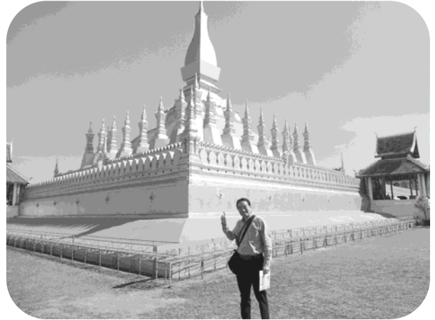
タートルアン寺院の前で

アジア連帯委員会の事務局に着任したのが昨年の11月6日、新任地での最初の重要任務として2018年ワーキング・スタディ・ツアー（WST）事務局を担当させて頂いた。多くの貴重な体験と新たな発見、そして何よりも団員の皆様や現地でのすばらしい方々との出会いの機会を得ることができ、アジア連帯委員会を支援して下さっている連合、支援産別、その構成組合と組合員・支援者のみなさんに衷心より感謝申し上げます。今回のWSTに参加し学んだ事と、また本報告書を編集する中で感じた率直な感想を述べ編集後記とします。