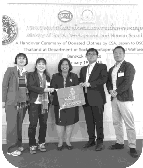
タイ衣類引き渡し式で

もう一つ印象的だったのは、サンティパープ高校生寮の寮生や卒寮生との交流です。家庭環境や貧困のために学ぶことを諦めるしない子ども達が、この寮があることで学ぶ機会を与えてもらっていることを自覚し、夢・目標に向かって勉強している事を聞き感動しました。実際に卒寮生の中には大学の医学部に進学した子や外務省など各省庁に勤めている子がたくさん居ることに驚かされましたし、寮生の夢・目標を質問した時にも、ハッキリとした夢・目標を持って勉強している事に驚きました。また、サンティパープ高校生寮でも歓迎して頂き、歌や踊りを披露してくれた後に行われたバーシーセレモニーで、寮生達が我々メンバー全員にスーフアンを次々に巻いてくれている時は本当に感動的でした。