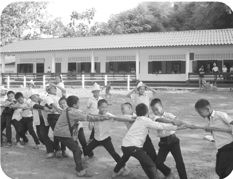
ナカン村小学校で綱引き