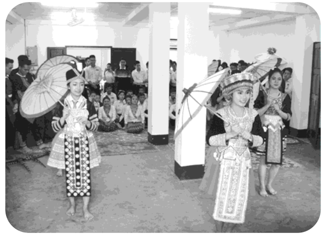
寮生による民族舞踊披露