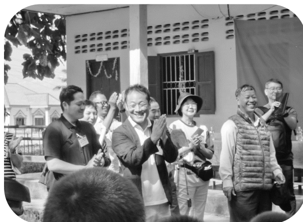
ナカン村小学校での代表挨拶

単組としては社会貢献活動の一環として2009年から中古衣料の支援活動に取り組み始め、現在も継続して活動に取り組んでいます。単組役員として活動の推進役である事から、取組み時期になると告知はもちろん、事務所に送られてくる中古衣料の状態を確認して、仕分け、梱包等の作業も行うなど積極的に関わっていた事もあり、毎年配布されているCSAワーキング・スタディ・ツアーの報告書は必ず目を通していました。又、過去に実際参加した友好労組の役員からもこのツアーの事を聞いていたので、個人的にも参加したい思いを持っていたタイミングで産別から単組に