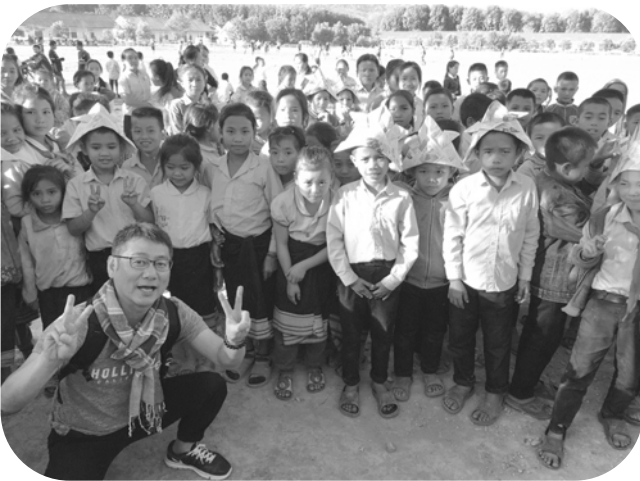
ホアナ村小学校で

今回のツアーに参加させて頂きご対応頂きました関係者の皆様、本機会を下さった基幹労連をはじめとする組合員の皆様に心より感謝申し上げます。又、ツアーに参加された団長、副団長はじめ、メンバーの皆様、本当にお疲れ様でした。