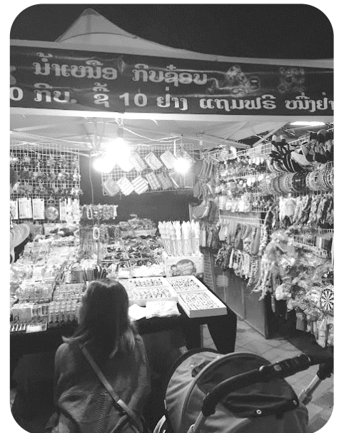
公式訪問前夜のビエンチャン市内 ナイトマーケット視察