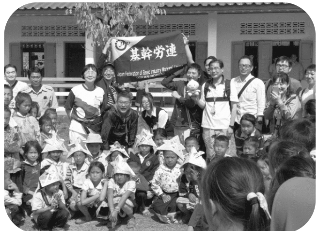
ファサン村小学校で

やはり現地に赴いて、実際に目で見て、触れて、交流してみても、報告書を読んだだけ、テレビの映像を見ただけでは、わからない、感じられないことを、非常に多く学ぶことができた素晴らしいツアーだったと思います。