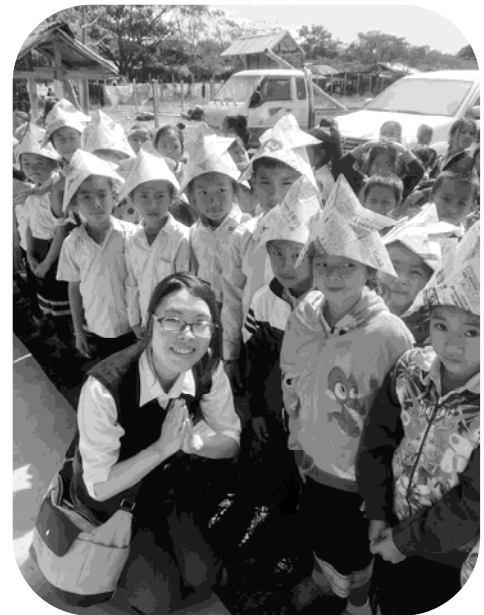
ホアナ村小学校で

今回の経験を無駄にせず、これからの活動に活かしていきたいと思えます。本当にありがとうございました。