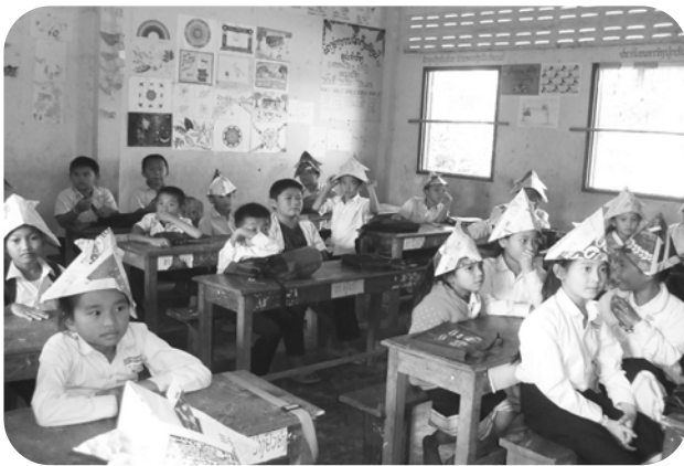
ナカン村小学校教室内で