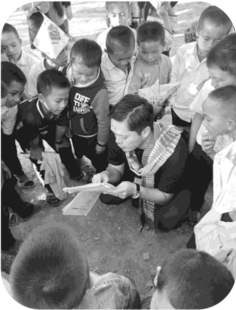
ホアナ村小学校で

今回のWSTへ参加させていただいて、大変貴重な体験をさせていただきましたことを、関係者の皆さまならびに現地で受け入れ等をして下さった方々に心より感謝申し上げます。