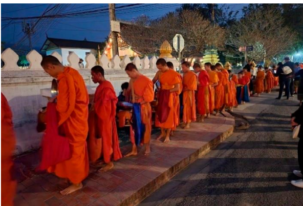
世界遺産ルアンパバン 早朝の托鉢と僧侶の列