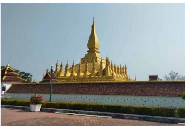
黄金の仏塔がシンボルの寺院 タートルアン