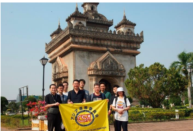
東南アジアの凱旋門 パトゥーサイ