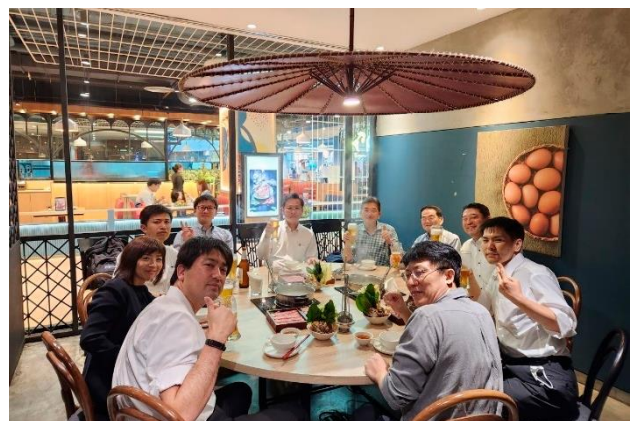
最終日の連合主催慰労会「皆さんお疲れ様でした」