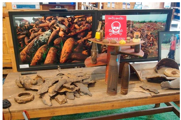
衝撃的だった地雷博物館