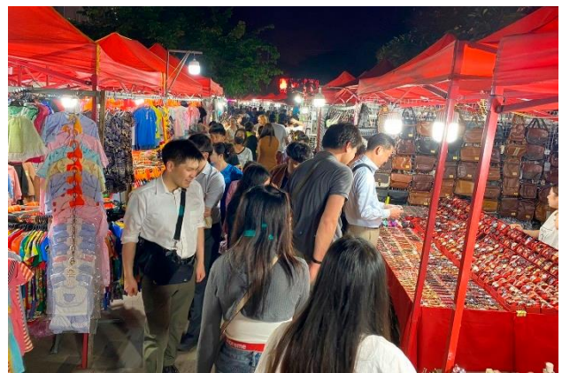
賑やかなビエンチャンナイトマーケット