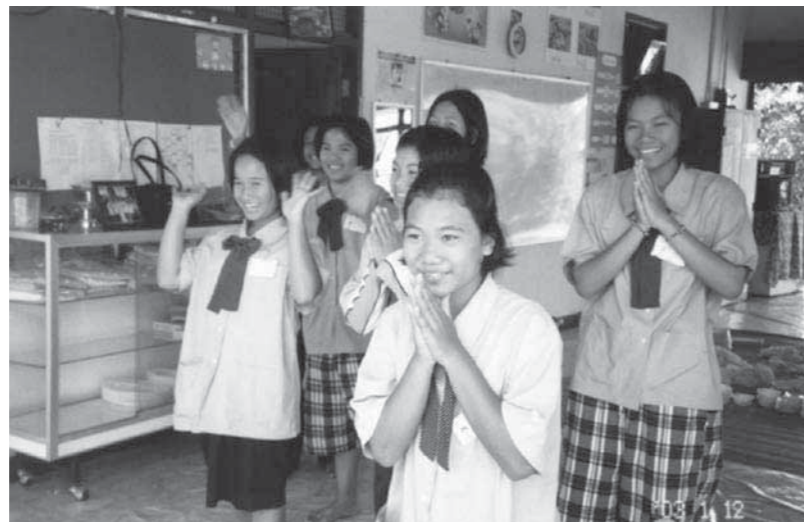
2 東北部福祉婦人職業訓練センターで実習訓練を受ける15~18歳の少女達。