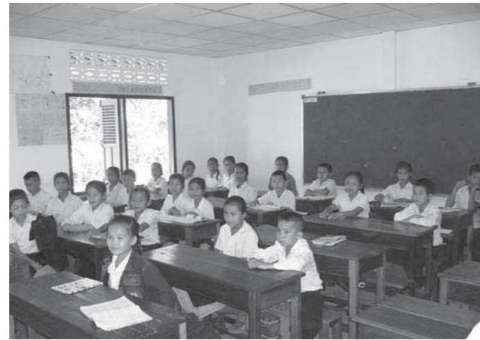
1 WSTチームが訪れた16番目校の授業風景。