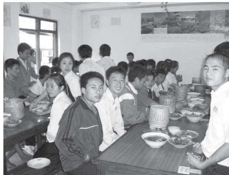
2 タイでは山岳民族カレン族の子供達が通う学校を訪問。