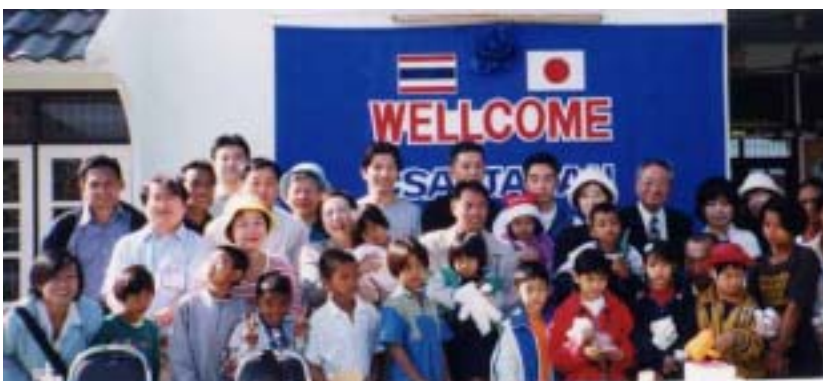
ウボンラチャタニ県母子福祉療養ホームでおもちゃをプレゼントした子供たちと