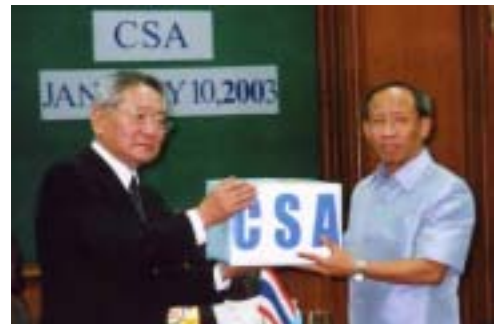
衣類の贈呈式を行うワンロップ局長(向右)と打田事務局長