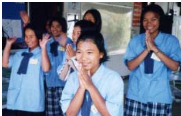
東北福祉婦人職業訓練センターで訓練を受ける 15~18才の少女達

これまで組織のスタンスあるいは個人の感性において取り組んできた国際貢献活動の重要性を、現地の人々と触れ合い、自分自身の感覚で確かめる事が出来、大変有意義で貴重な経験をさせてもらったと感謝しています。コップンマーカップ（ありがとうございました）。