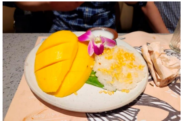
タイで大人気マンゴーに米 / カオニャオ・ナムアン