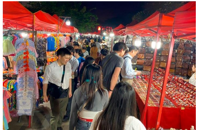
賑やかなビエンチャンナイトマーケット