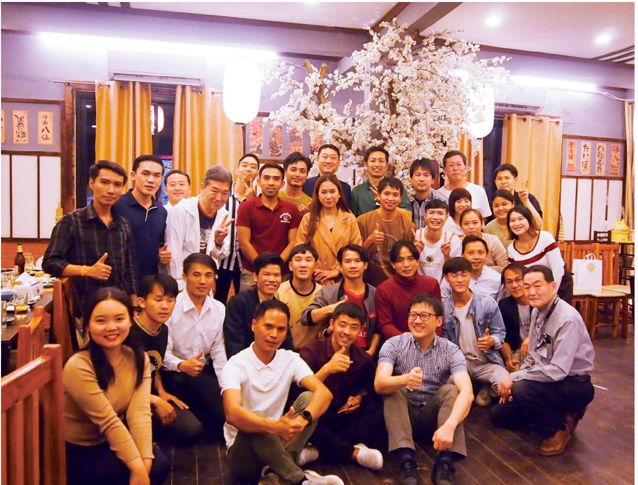
サンティパーブ高校卒業生との熱い交流会