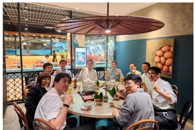
最終日の連合主催慰労会「皆さんお疲れ様でした」