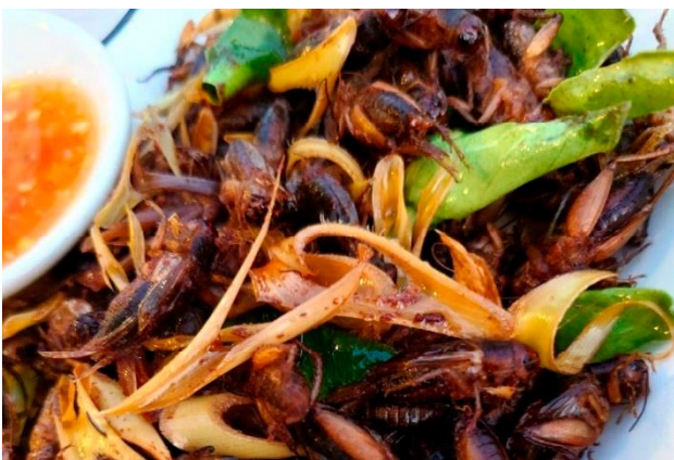
栄養価抜群！意外に美味 / コウロギの素揚げ