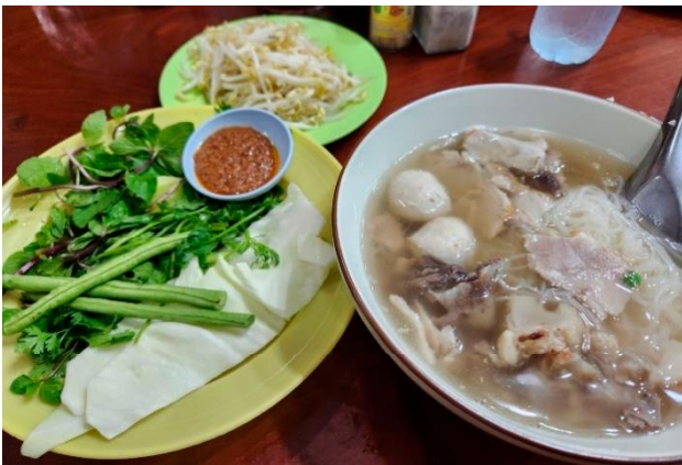
パクチーの香りがたまらない麺料理 / カオブン