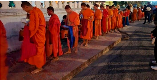
世界遺産ルアンパバン 早朝の托鉢と僧侶の列