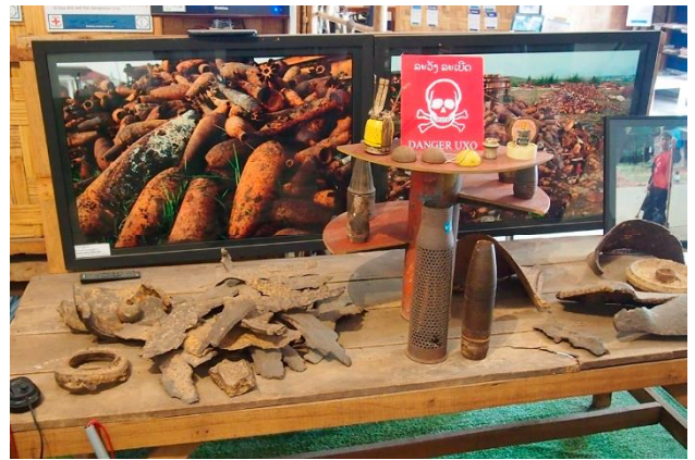
衝撃的だった地雷博物館