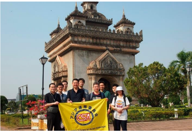
東南アジアの凱旋門 パトゥーサイ